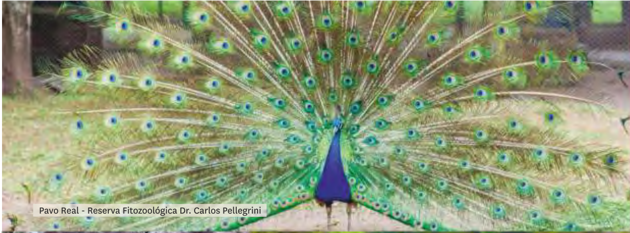
Pavo Real - Reserva Fitozoológica Dr. Carlos Pellegrini