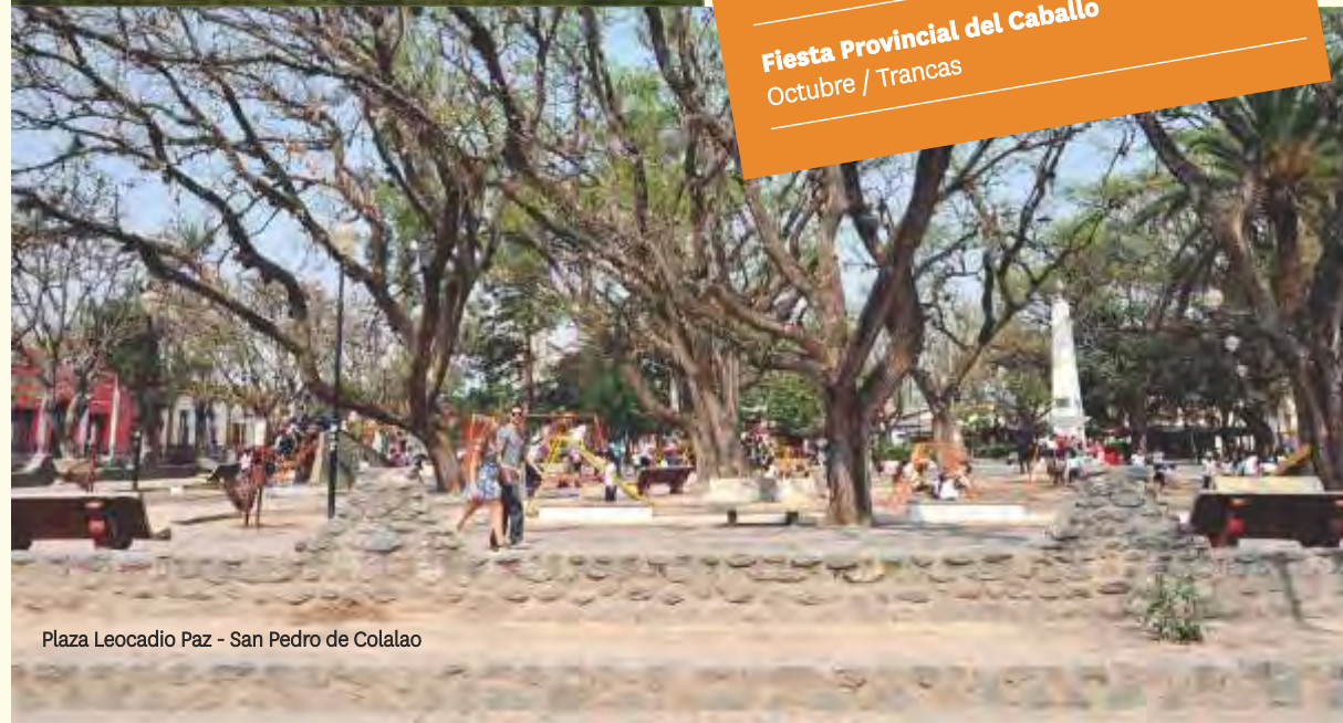
Plaza Leocadio Paz - San Pedro de Colalao