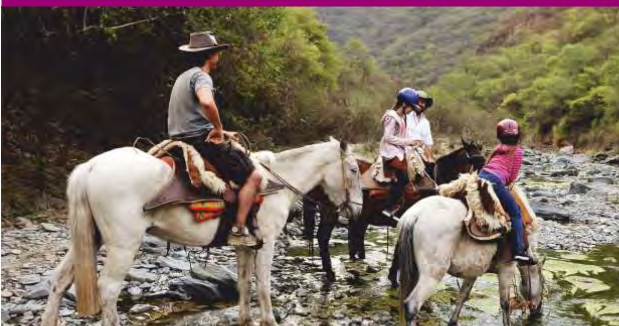
Cabalgata - San Pedro de Colalao

Las artesanías ocupan un lugar especial en esta zona, los trabajos en cuero, curtiembres, peleros, peyones y tejidos tienen renombre nacional e internacional.