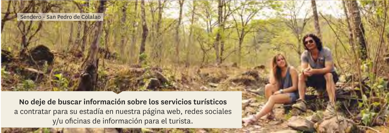
Sendero - San Pedro de Colalao

No deje de buscar información sobre los servicios turísticos a contratar para su estadía en nuestra página web, redes sociales y/u oficinas de información para el turista.