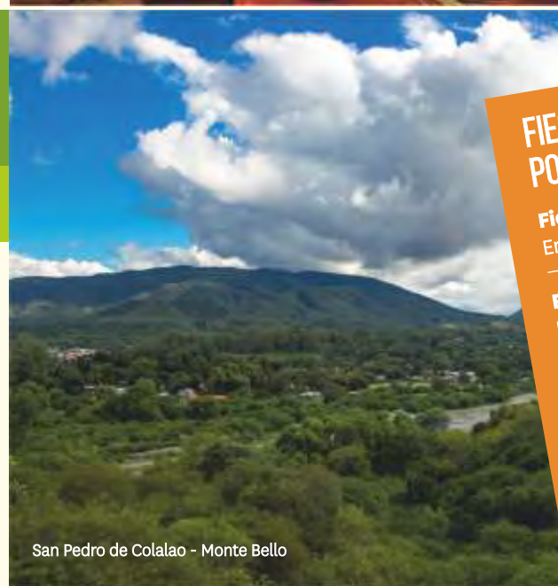
San Pedro de Colalao - Monte Bello